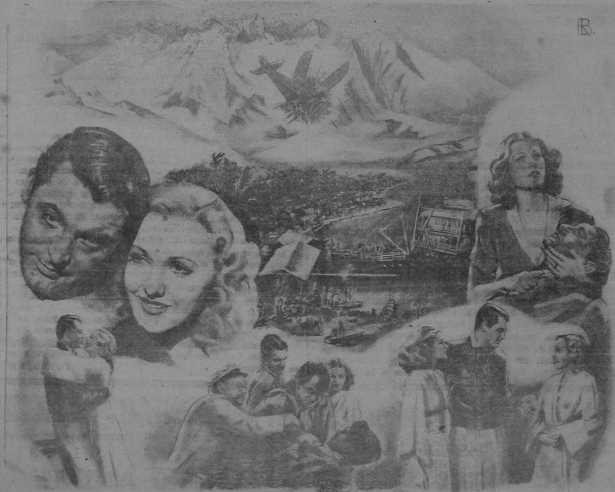
La impresión de un artista del espectacular film de la Columbia "Solo los Angeles tienen Alas" revelando una serie de emocionantes escenas que toman lugar en esta prodigiosa obra de Howard Hawks. Los protagonistas principales son Cary Grant y Jean Arthur, que aparecen juntos por primera vez. En otros roles importantes vemos a Rita Hayworth, Richard Barthelmess y Thomas Mitchell

Artículo V — Los nombres del autor y de la obra premiada será comunicados el 12 de octubre de cada año, en el curso de una solemne reunión pública ("Mentor").